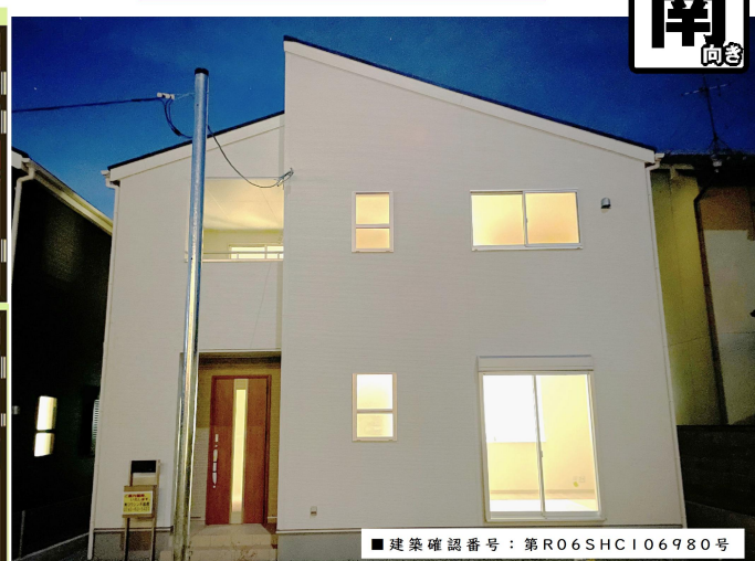
■建築確認番号：第R06SHC106980号