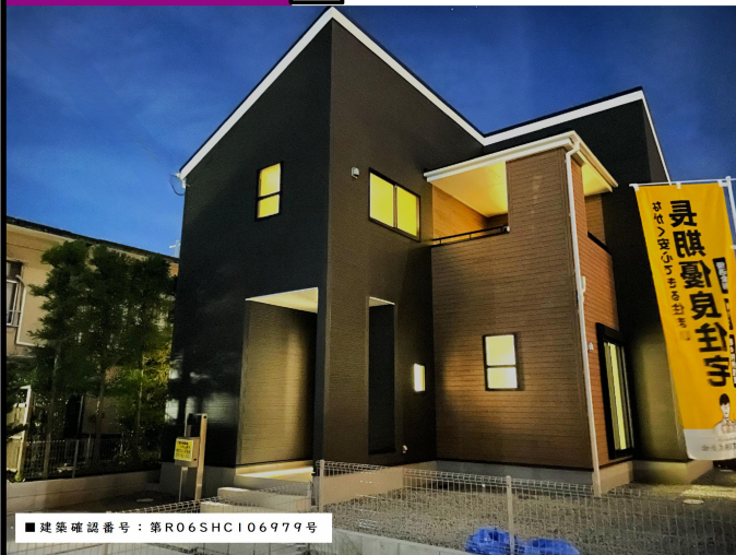
■建築確認番号：第R06SHC106979号