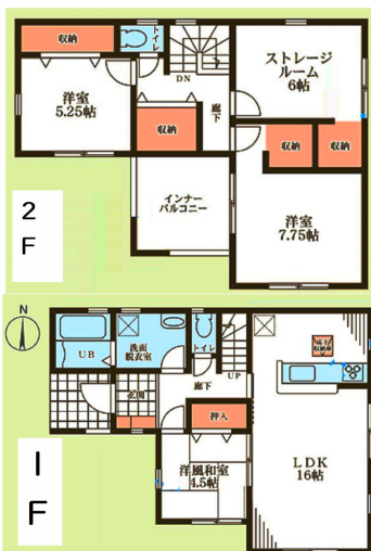
■土地面積：154.02㎡(46.59/坪) ■建築面積：107.65㎡(32.56/坪)