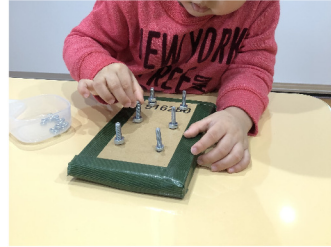
巧緻性トレーニング