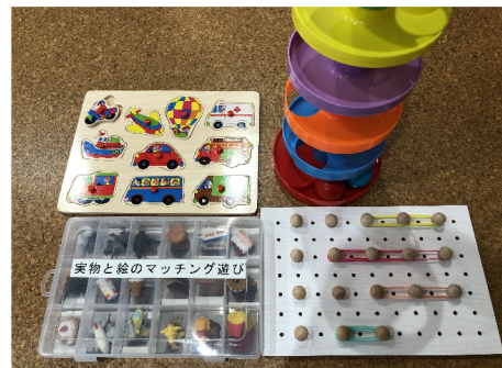
認知発達治療の実践