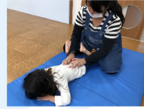
集団療育 個別療育 BBA