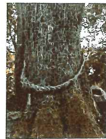
御神木 苔が付いた