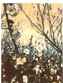
いた座論梅 わが家に残って