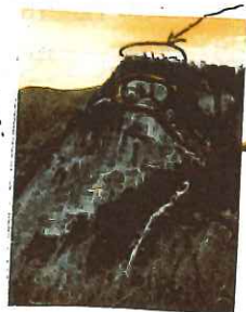
下からながめる 雄鉾(鼻) 雌鉾(鬼の目)

頂上は雄鉾、雌鉾に分かれています。雌鉾は鬼の目と呼ばれる巨石が乗っている 日本最大級のスラブです。鬼の目にも登ることができ、10坪位の広さがありました。 もちろん絶壁で谷までどれ位あるでしょうか？数メートル？百メートル以上？ とにかく足がすくみます。