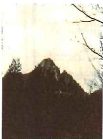
登山開始 すぐに目に そびえる 鉾岳山頂

小さな滝が重なるように流れる鹿川に沿って、1時間ほど登ると 巨大なスラブ(一枚岩)が見られるようになります。そのスラブを滑るように 流れる大滝を仰ぐと、すぐ上の方に「パックマン」が居るとの事。 居ました③ いました。巨大な「パックマン」④です。直径7メートル⑤ しばらくおぼさん達「パックン岩」に遊んでもらいました。