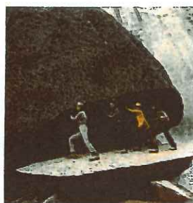
左)石を滑る ために流れる大滝 右)会いたかった パックン岩