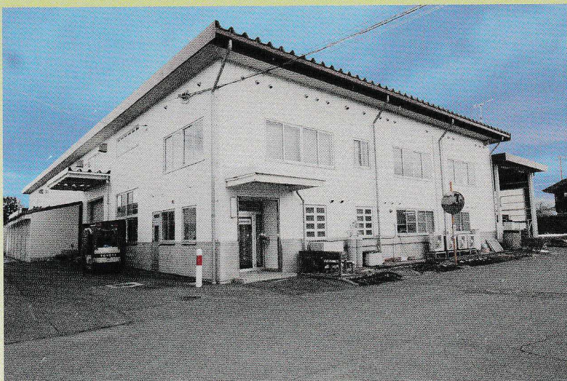
東北工場社屋 TOHOKU PLANT & OFFICE