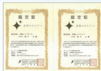
産廃エキスパート 中間処理業・収集運搬業

産業廃棄物処理業者の任意の申請に基づき、適正処理、資源化及び環境に与える負荷の少ない取組を行っている優良な業者を、第三者評価機関として都が指定した(財)東京都環境公社が評価・認定する制度において、最上位である産廃エキスパートに認定されています。