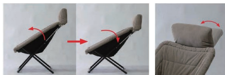
2段階の座面角度調整が可能