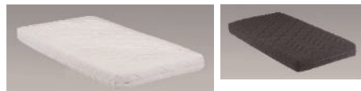
グランケアサポートプロ (ポケットコイル):18cm厚(269頁に記載)

1 1050Sキャビ昇降3モーター 電動ベッド(フレームのみ) W1050×L2125×H740~1070 399,000円(非課税) 才数 27.5 個口数 4