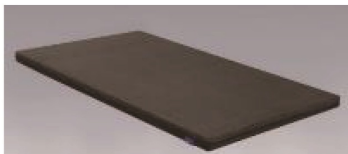
G-181U(ウレタン):8cm厚(269頁に記載)