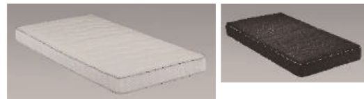
グランケアミドルプロ (ポケットコイル):18cm厚(269頁に記載)