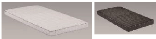
グランケアスリムプロ (ポケットコイル):13cm厚(269頁に記載)