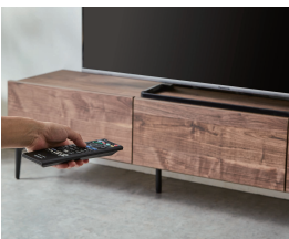
ガラス扉イメージです