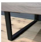
ブラックアイアン脚