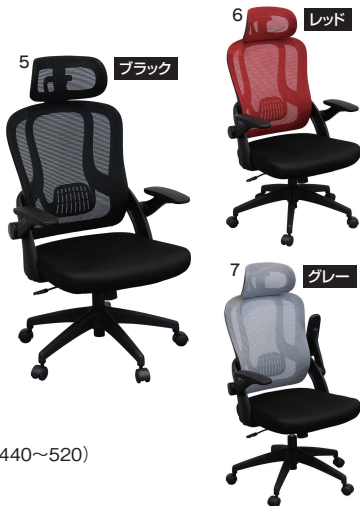
5・6・7 630オフィスチェア W630×D610×H1130~1210(SH440~520)