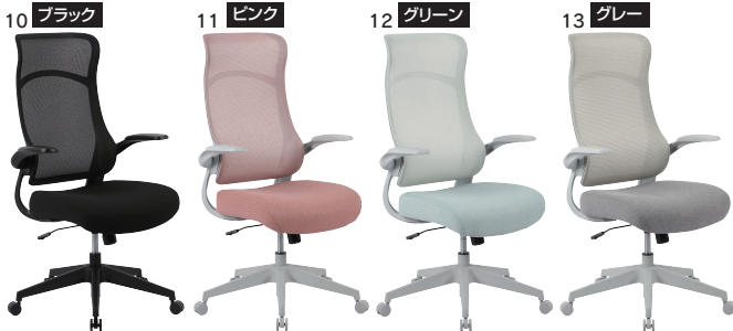
10・11・12・13 670オフィスチェア W670×D680×H1070~1150(SH430~510)