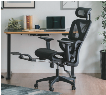
1 640オフィスチェア W640×D680×H1220~1300(SH475~550)