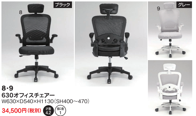
8・9 630オフィスチェア W630×D540×H1130(SH400~470)