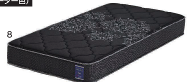
ブラック(オーダー色)