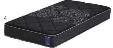
ブラック(オーダー色)