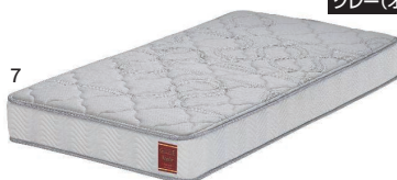
グレー(オーダー色)