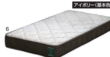
アイボリー(基本色)