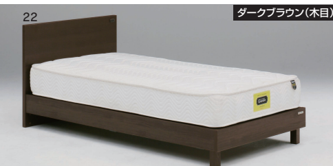
ダークブラウン(木目)