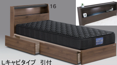
Lキャビタイプ 引付