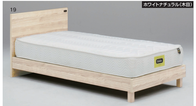
ホワイトナチュラル(木目)