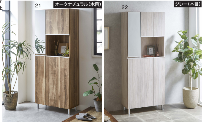
21 オークナチュラル(木目)