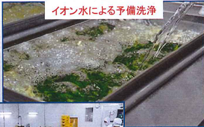
イオン水による予備洗浄