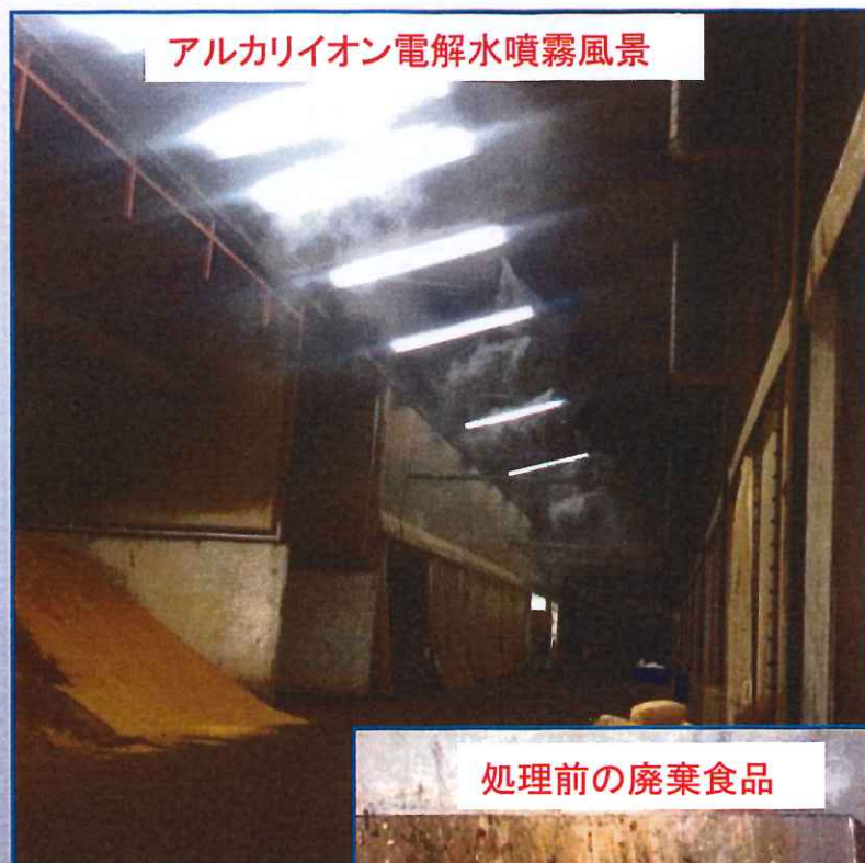
アルカリイオン電解水噴霧風景