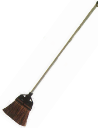
庭シダほうき長柄