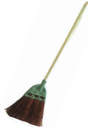
庭シダほうき短柄