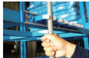
白いキャッチ部にほうきの柄を押し。