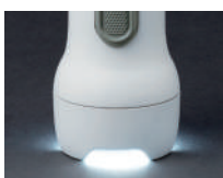
立てた時でも 明かりが見えるデザイン