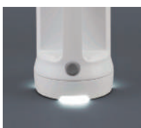
立てた時でも 明かりが見えるデザイン