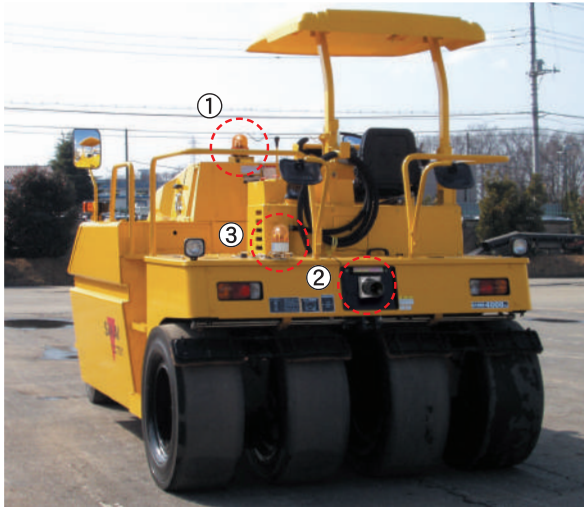
※写真は、実際の商品と多少異なります。

パノラマアール・ツーは、ロードローラーなど特殊車両の後端部に取り付け、超音波センサーがエリア内の人や車両を検知して回転灯とブザー音で作業者とオペレーターに警告し、未然に事故・災害を防ぐための安全補助装置です。