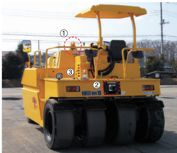
※写真は、実際の商品と多少異なります。

パノラマアール・ツーは、ロードローラーなど特殊車両の後端部に取り付け、超音波センサーがエリア内の人や車両を検知して回転灯とブザー音で作業者とオペレーターに警告し、未然に事故・災害を防ぐための安全補助装置です。