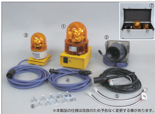
※本製品の仕様は改良のため予告なく変更する事があります。