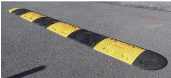
○設置参考例：本体6枚／先端2枚／全幅3500m