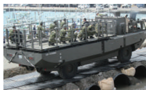
国土交、防衛省でも使われています。