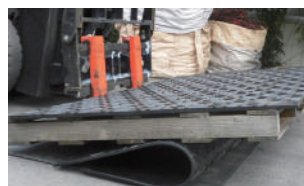
180°の曲げ試験でも割れません。