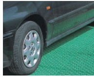
一般駐車スペースに