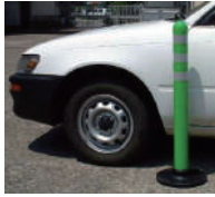
車輪で踏み潰してもすぐ復元