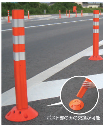
ポスト部のみ交換が可能