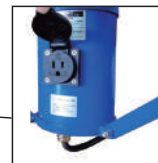
連結用 サービスコンセント