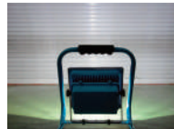
広範囲を明るく照らします。