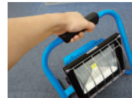
持ち運びに便利な取手付き。