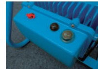
電源と輝度切替のスイッチがあります。