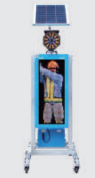
ソーラー式 LED電光盤 (フルカラー1文字3段)