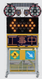
ソーラー式 LED電光盤 (フルカラー6文字2段)