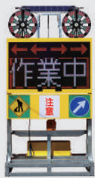
ソーラー式 LED電光盤 (フルカラー5文字3段)