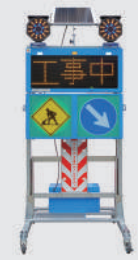
ソーラー式 LED電光盤 (アンバー3文字1段)