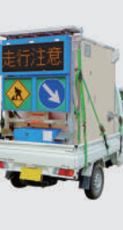
トイレカー用 ソーラー式 LED電光盤 (アンバー3文字1段)