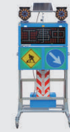
ソーラー式 LED電光盤 (フルカラー3文字1段)