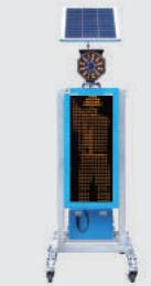
ソーラー式 LED電光盤 (アンバー1文字3段)