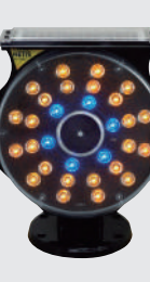
スプレnder G III