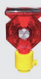
ソーラー式 セフティー フラッシュ (KSF-3SN)