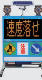
ソーラー式 LED電光盤 (アンバー4文字2段)