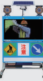
ソーラー式 LED電光盤 (フルカラー4文字2段)