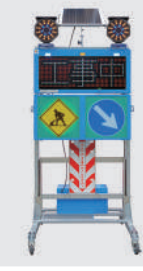
ソーラー式 LED電光盤 (フルカラー3文字1段)