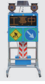
ソーラー式 LED電光盤 (アンバー3文字1段)