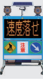
ソーラー式 LED電光盤 (アンバー4文字2段)