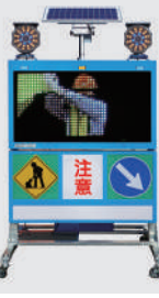
ソーラー式 LED電光盤 (フルカラー4文字2段)