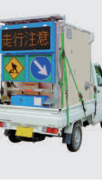
トイレカー用 ソーラー式 LED電光盤 (アンバー3文字1段)