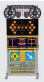
ソーラー式 LED電光盤 (フルカラー6文字2段)