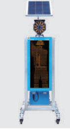
ソーラー式 LED電光盤 (アンバー1文字3段)