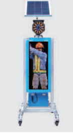
ソーラー式 LED電光盤 (フルカラー1文字3段)