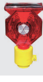
ソーラー式 セフティー フラッシュ (KSF-3SN)