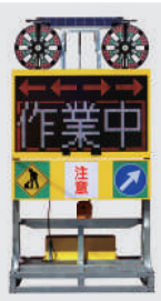
ソーラー式 LED電光盤 (フルカラー5文字3段)