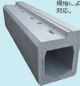
長さ調整長一片側-250mまで