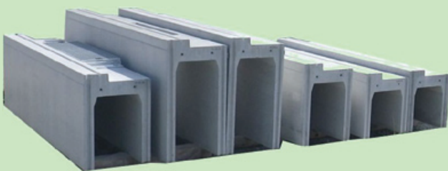
長さ調整長一片側-200mまで