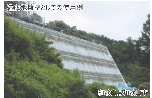
造成地擁壁としての使用例