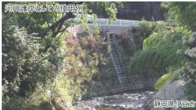
河川護岸としての使用例