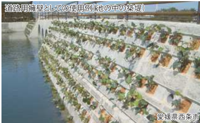
道路用擁壁としての使用例 (池の中の築堤)