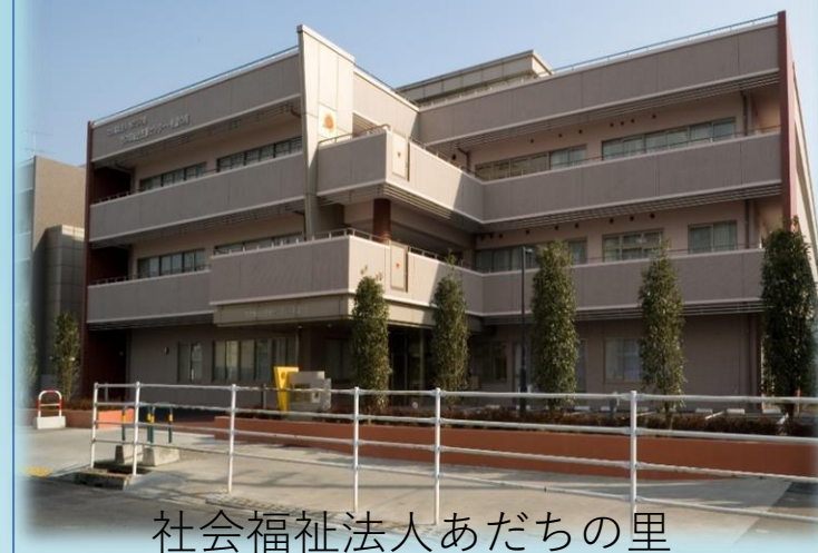
社会福祉法人あだちの里