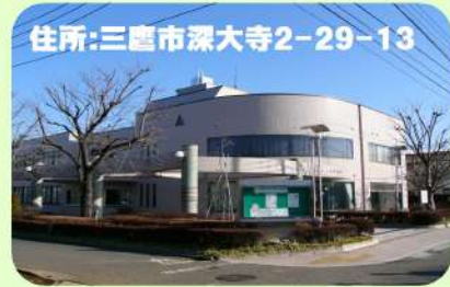
住所:三鷹市深大寺2-29-13

喜寿2名・米寿14名・白寿1名・紀寿（百歳）1名の方をご紹介します、皆さんでお祝いしています。絵手紙クラブの方が描かれたカードにお一人ずつの写真を添えて、所長からのお祝いの言葉とともに渡しました。100歳、99歳を迎えた方のお元気の姿と挨拶に「私たちががんばらないといけないわね。あんなふうに歳を重ねたいわ」と周りの皆さんも元気をいただきました。おめでとうございます！