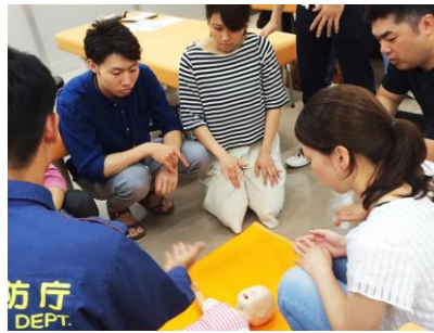
スペシャリスト育成委員会 小児救急救命研修