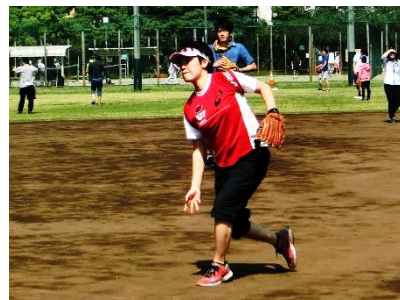
ソフトボール大会