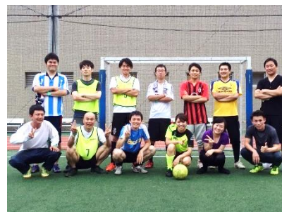
フットサルチーム