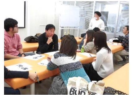
スペシャリスト育成委員会 難病