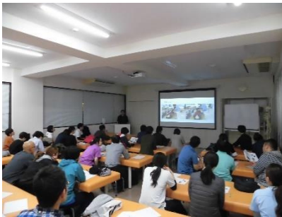
ブラッシュアップ