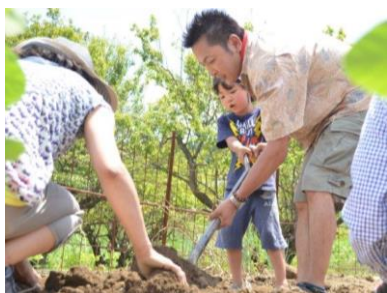
アグリ(農業活動)体験