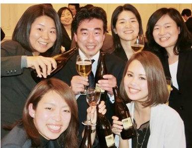
経営方針発表会後の懇親会