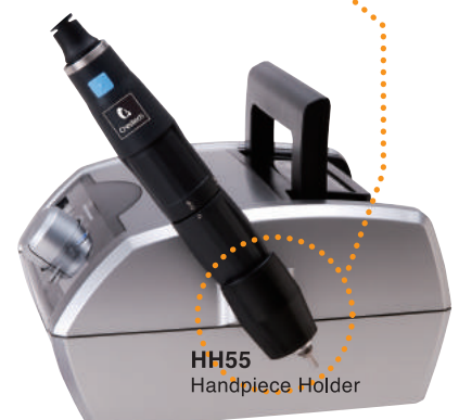
HH55 Handpiece Holder

出力コネクターA・Bのどちらにもモーターを差し込んでもコントローラーが自動で認識しています。バリエアブルフットコントローラーVC90もコネクターに差し込むだけで、モードの切り替えを自動に行います。