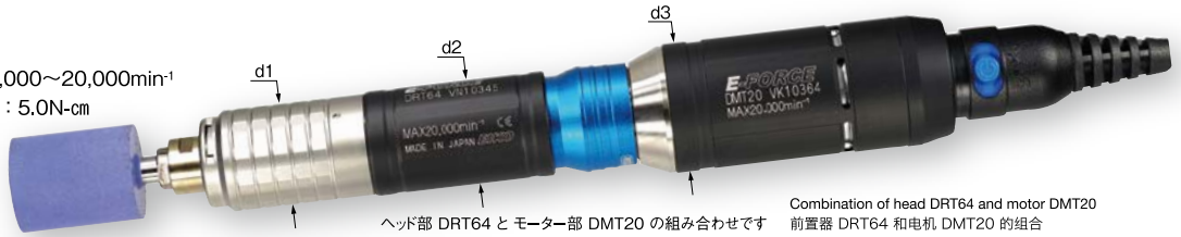
ヘッド部 DRT64 と モーター部 DMT20 の組み合わせです 前置器 DRT64 和电机 DMT20 的组合