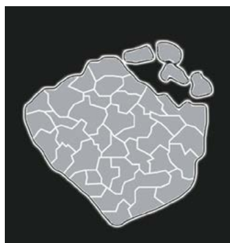
■ 多結晶ダイヤモンド砥粒 自生作用イメージ図

多結晶ダイヤモンド砥粒は、単結晶ダイヤモンド砥粒より3倍も高い研磨加工圧力を誇り、スピーディーな研磨加工が可能です。マイクロ構造化した粒子表面が、ラッピング工程中、適度に脱落を繰り返します。この現象により、新しく鋭いカッティングエッジが粒子表面に現れ、絶えず高い研磨速度を可能にします。