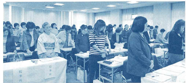
「母に幸あれ」を斉唱