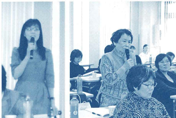
積極的に質問・意見交換