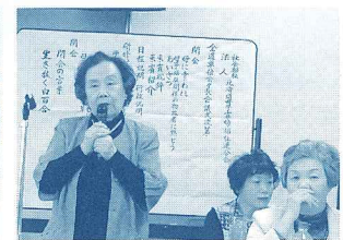
理事席からのアドバイス