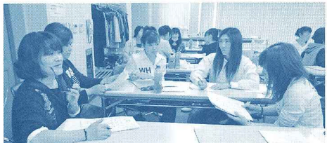
各現場担当ごとに分かれグループディスカッション