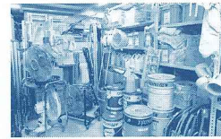
4Sを守り抜く清掃用具