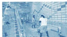
礼儀・サービスを意識しながらの清掃作業