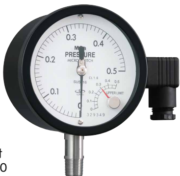
1 接点付 AEM100