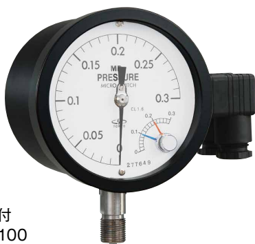
2 接点付 A2EM100