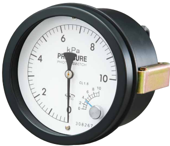
パネル埋込型 Panel mounting DEP75 型 D2EP75 型 DEP100 型 D2EP100 型