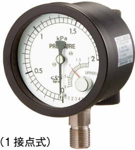
AEP75 型 (1 接点式) A2EP75 型 (2 接点式)