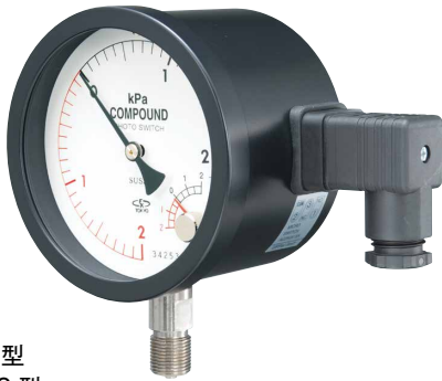
AEP100 型 A2EP100 型