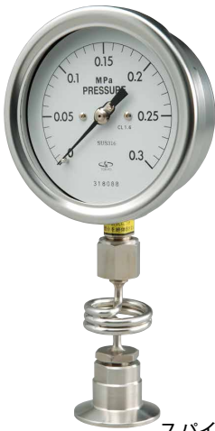
スパイラル型放熱管 Spiral type heat dissipation pipe