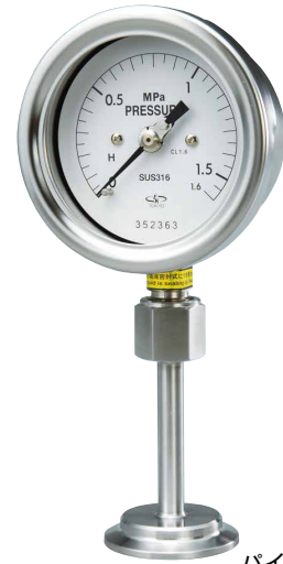
パイプ型放熱管 Pipe type heat dissipation