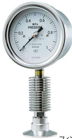
フィン型放熱管 Fin type heat dissipation pipe