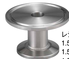
レジュースー 1.5S × 8A 1.5S × 15A 1.5S × 2S その他 SUS316 製