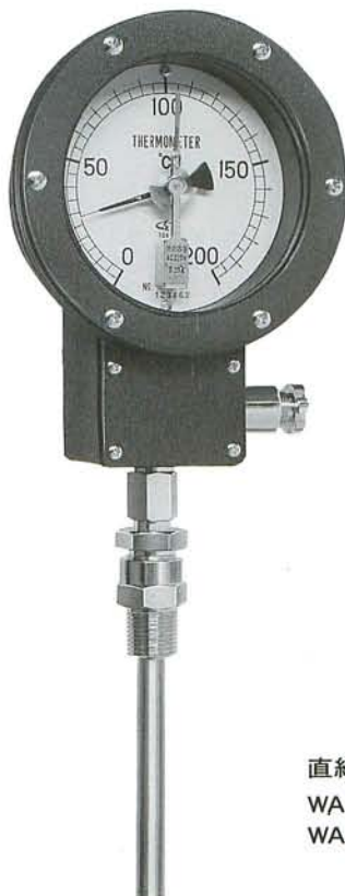
直結型 WAE 100 WAE 150

WBE100・WBE150型は接点機構を内蔵した計器本体を外部より密封したタイプで各開口部はOリングにより内部気密は保持されておりあります。