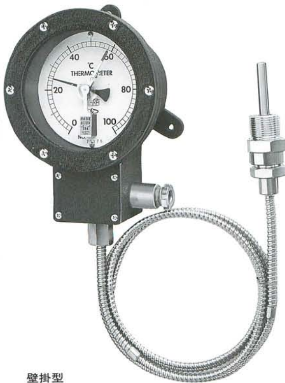
壁掛型 WBE 100 WBE 150