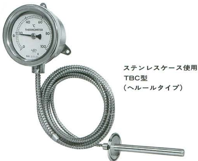
ステンレスケース使用 TBC型 (ヘルールタイプ)