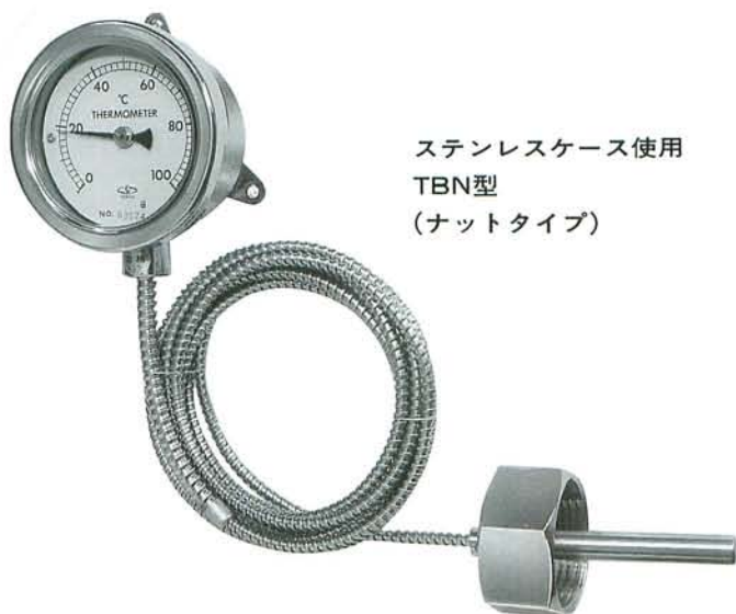
ステンレスケース使用 TBN型 (ナットタイプ)