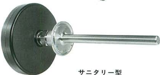
サニタリー型 ヘルール付保護管

バイメタル式温度計は取付方法が簡単で、全体が小型に出来ており、正確な温度測定が手軽にえられます。