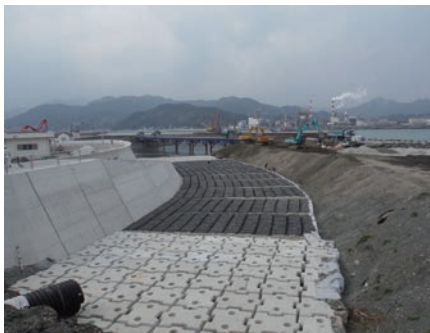
海岸 | 根固め対策