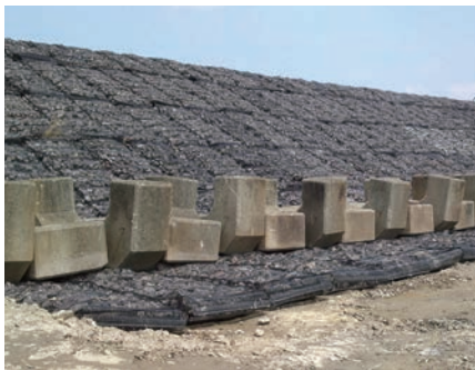
災害復旧 | 決壊堤防の応急対策