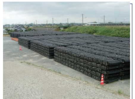
災害復旧 | 災害用備蓄資材