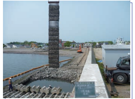
施設 | 急勾配碎石層の構築