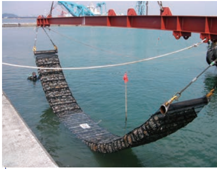
港湾 | 裏込石の侵食防止