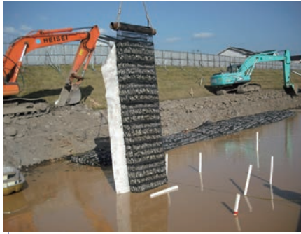
河川 | 堤防の侵食防止