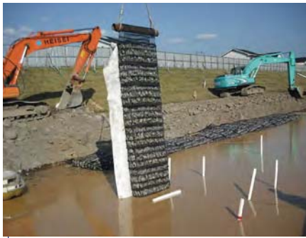
河川 | 堤防の侵食防止