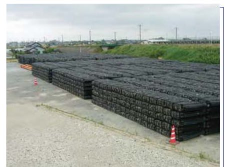
災害復旧 | 災害用備蓄資材