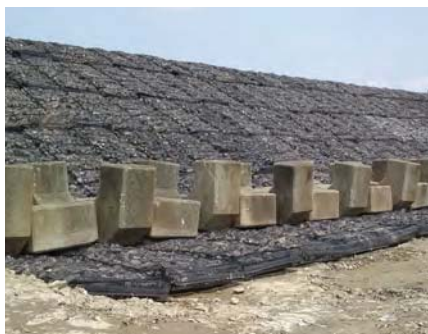
災害復旧 | 決壊堤防の応急対策