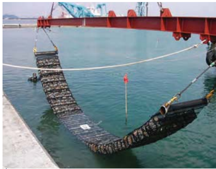
港湾 | 裏込石の侵食防止