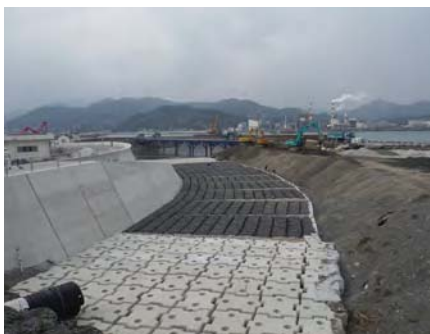
海岸 | 根固め対策