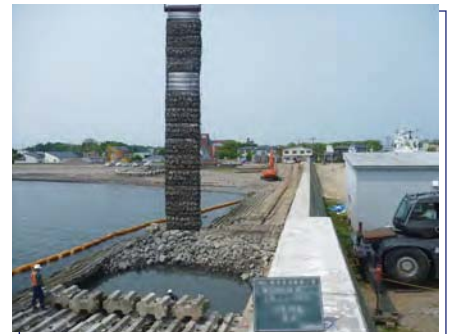
施設 | 急勾配砕石層の構築