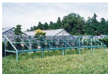
屋外暴露試験状況