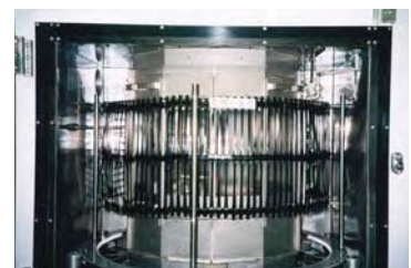
促進暴露試験状況 (サンシャインウェザーメーター)