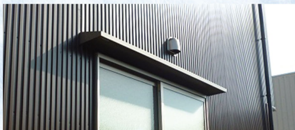
へいせいネオステンレス 200×1950施工例

注 弊社ひさし全製品の側面はプラスチック等は一切使用していません。雨漏れ・割れ・ねじれ等の心配もありません。丈夫で安心して御使用いただけます。