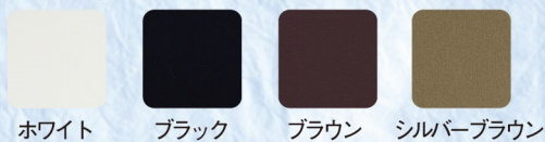
ホワイト ブラック ブラウン シルバーブラウン