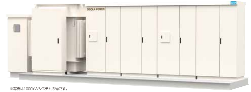
*写真は1000kWシステムの物です。

省エネ大賞受賞の`エアコン`レス、パワーコンディショナを搭載。高効率&スマートを実現した太陽光発電特高変電設備パッケージ。