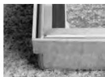
スライドレール構造