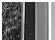
1次パッキン(内枠上部)