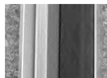
2次パッキン(外枠下部)