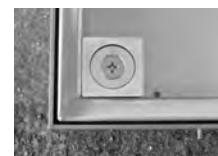
連結固定用ボルト